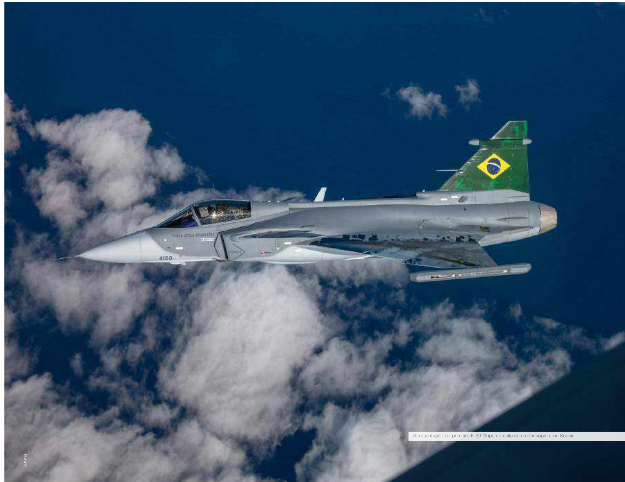
Apresentação do primeiro F-39 Gripen brasileiro, em Linköping, na Suécia.

5.2. Os objetivos estabelecidos nesta Política direcionarão a formulação da Estratégia Nacional de Defesa, documento que estabelece as ações para a consecução daqueles objetivos.