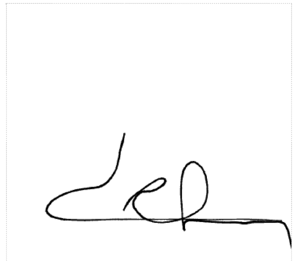
Assinatura de João Ubaldo Correia Lima

Pontos de autenticação: Assinatura na tela IP: 189.6.18.220 / Geolocalização: -15.761974, -47.877622 Dispositivo: Mozilla/5.0 (Linux; Android 10; K) AppleWebKit/537.36 (KHTML, like Gecko) SamsungBrowser/25.0 Chrome/121.0.0.0 Mobile Safari/537.36 Data e hora: Junho 12, 2024, 08:24:21 Telefone: + 5561992966763 ZapSign Token: 30fd7cb3-****-****-****-8704c1607075