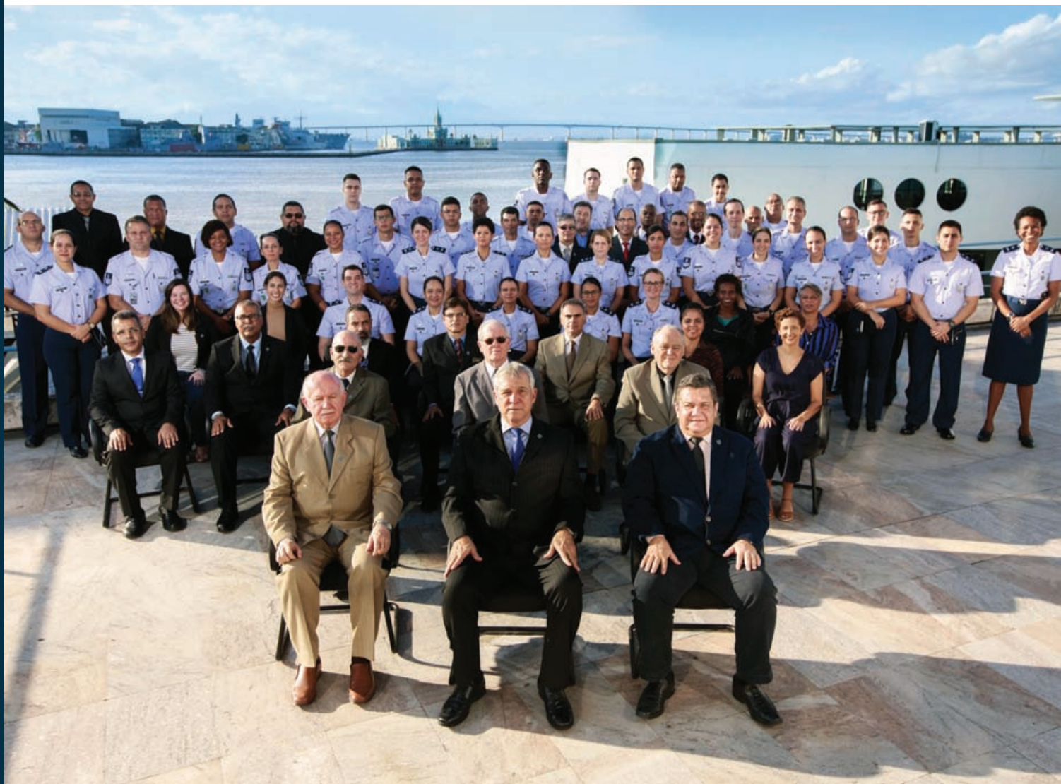
Efetivo INCAER 2019