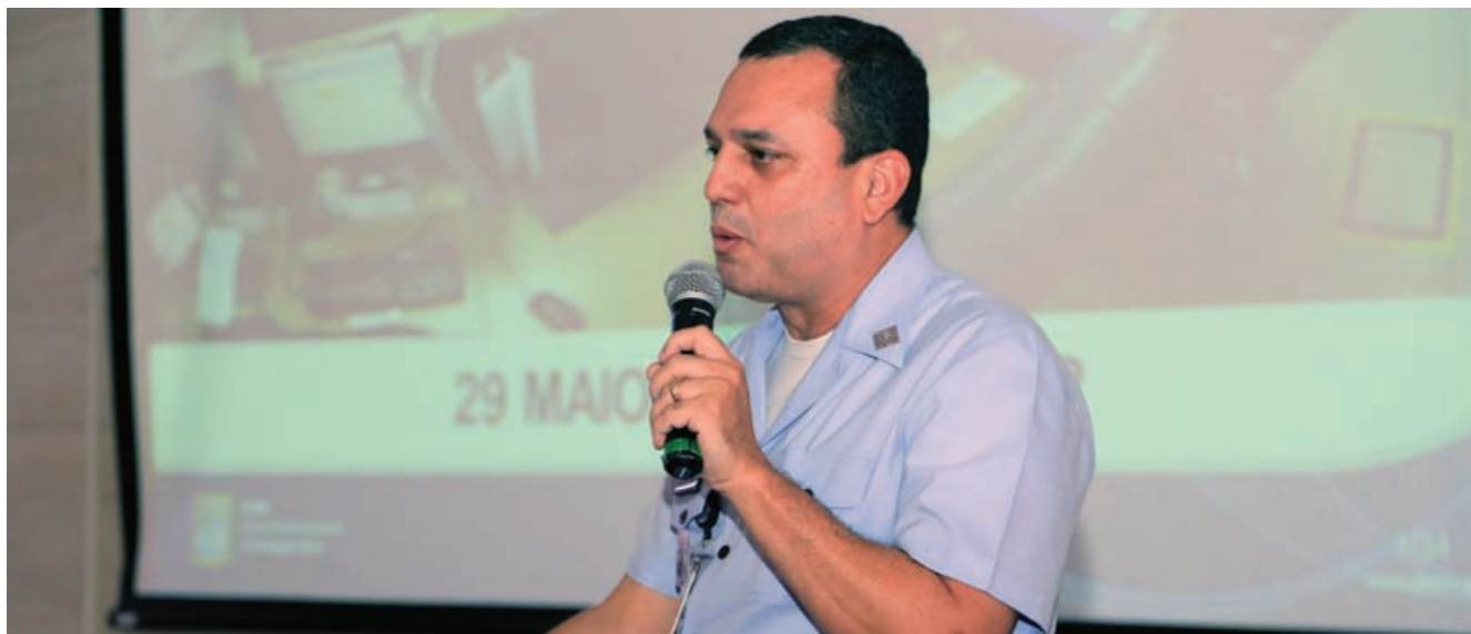
Cel Sidnei durante a apresentação

O 267º Encontro no INCAER, realizado no dia 29 de maio de 2019, teve como tema “CGNA: o controle de fluxo e CNS/ATM”. A palestra foi apresentada pelo Cel Av Sidnei Nascimento de Souza , Comandante do Centro de Gerenciamento da Navegação Aérea (CGNA).