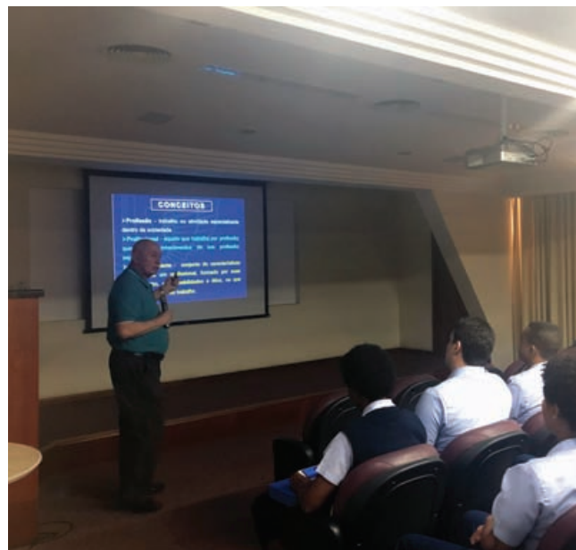
Maj Brig Scheer

Em 2017, o Instituto Histórico-Cultural da Aeronáutica recebeu uma determinação do Estado-Maior para realizar com seu efetivo o Programa de Fortalecimento de Valores (PFV). O Programa que tem como objetivo orientar ações e pensamentos, voltando-os para os valores fundamentais da instituição e da vida militar, se tornou uma grande e importante ferramenta no dia a dia do Instituto.