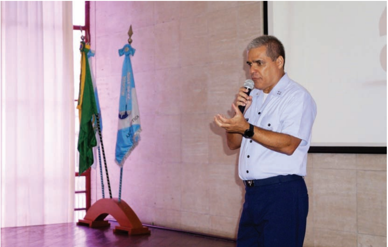
Momento da palestra realizada pelo Ten Brig Egito

Dando continuidade ao ciclo de palestras do INCAER, no dia 26 de agosto 2019 o Instituto Histórico-Cultural da Aeronáutica recebeu o Ten Brig Ar Antônio Carlos Egito do Amaral , Comandante do Comando de Preparo (COMPREP), que ministrou sobre o tema: “Reestruturação da FAB no âmbito do COMPREP”.