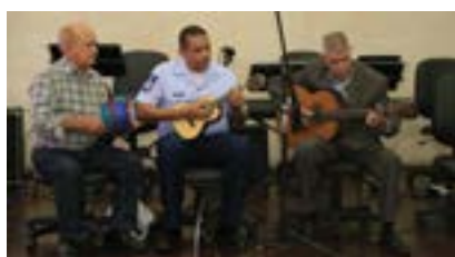
Grupo musical interpreta “Na baixa do sapateiro”