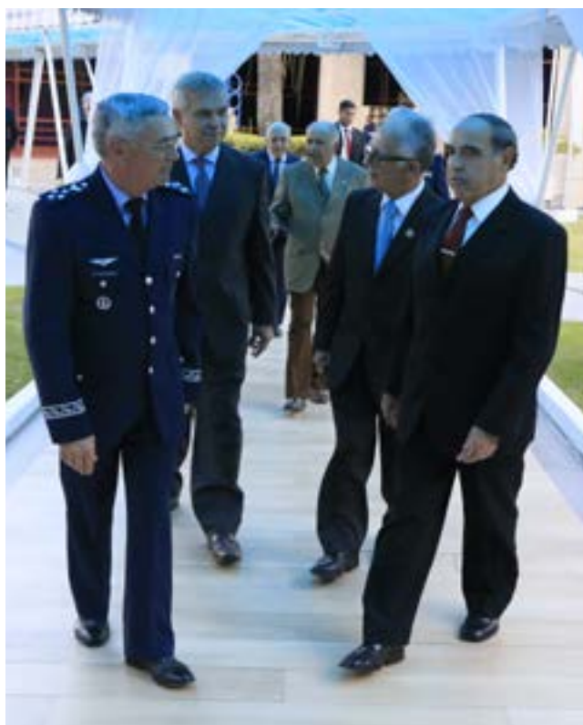
Chegada das autoridades