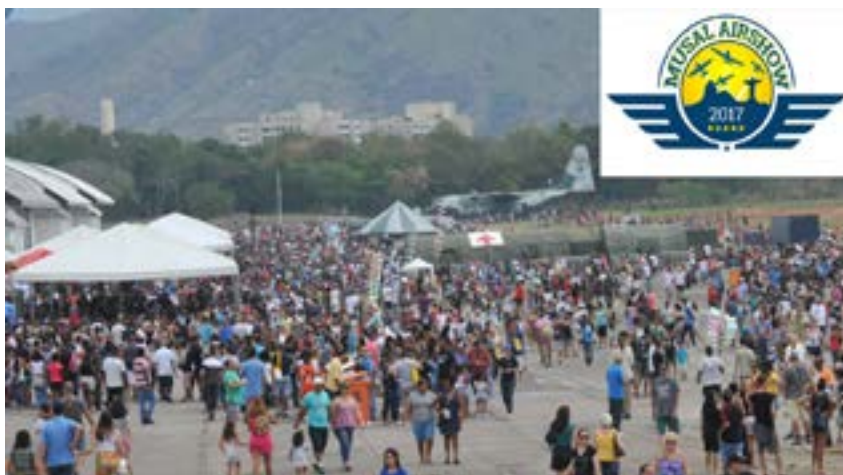
Evento no MUSAL atrai mais de 50 mil pessoas durante o final de semana

O domingo foi marcado pelos shows aéreos; mesmo sob ameaça de chuva,