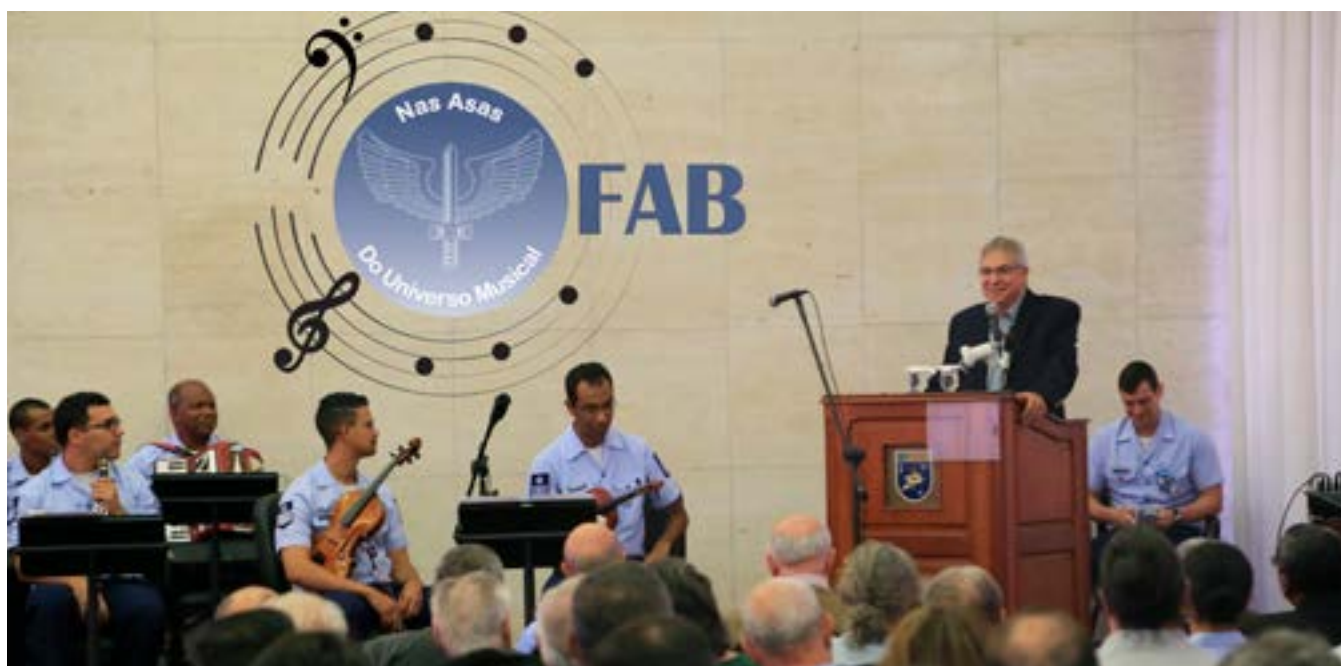
Diretor do INCAER realiza a abertura do 256º Encontro no INCAER

O “256º Encontro no INCAER”, realizado na tarde do dia 29 de novembro de 2017, emocionou a plateia presente com apresentações de três pequenos grupos musicais formados por integrantes das bandas de música sediadas na Base Aérea dos Afonsos e nas Alas 11 e 12.