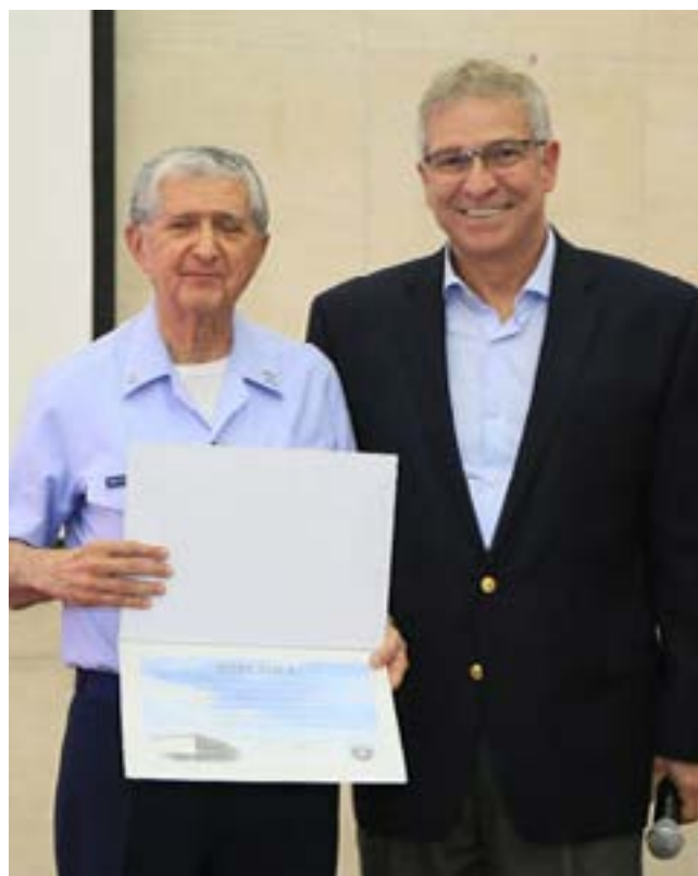
Ten Brig William recebe diploma do Diretor do INCAER

Como de costume, a apresentação contou com a prestigiosa participação de membros do Conselho Superior do INCAER.