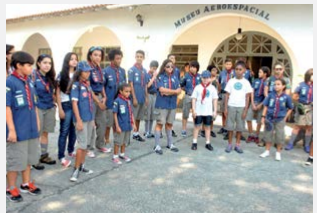
Integrantes do Grupo Escoteiro Atol das Rocas em visita ao MUSAL

O encontro, coordenado e realizado pelo 88º Grupo Escoteiro Atol das Rocas, já faz parte das atividades programadas pela Seção de Recursos Educativos do MUSAL, que, neste ano, contou com a presença de 74 escoteiros, além de instrutores acompanhantes.