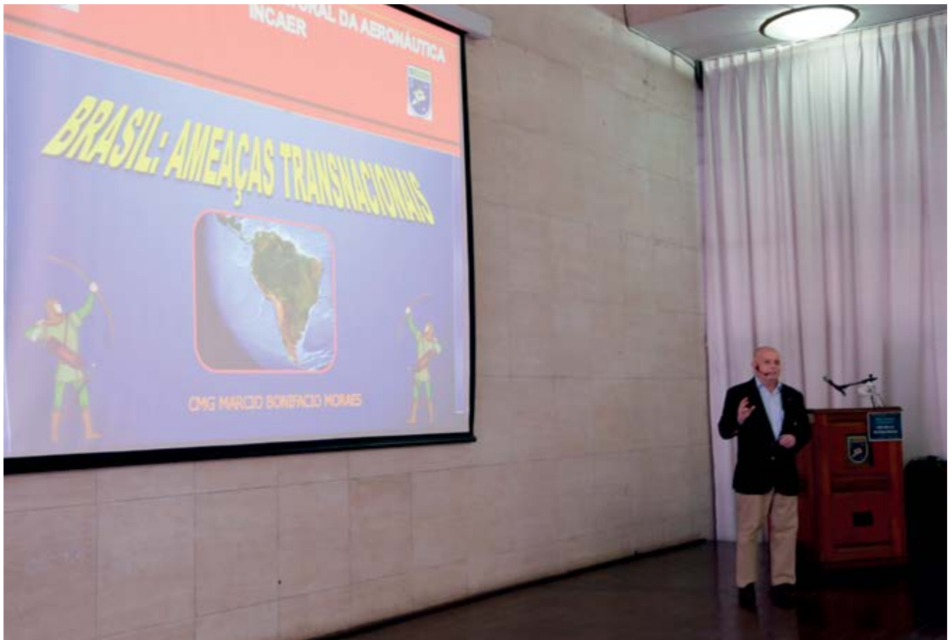
CMG Márcio inicia a palestra “Brasil: ameaças transnacionais”.

No 241º Encontro no INCAER, realizado no dia 27 de abril de 2016, o Capitão-de-Mar-e-Guerra Márcio Bonifácio Moraes, Conferencista Emérito da Escola Superior de Guerra, proferiu a palestra “BRASIL: Ameaças Transnacionais”. O palestrante destacou as principais ameaças transnacionais, como: narcotráfico, tráfico de armas, fluxo ilícito de capitais, terrorismo internacional, espionagem, sabotagem e ameaças cibernéticas. Também abordou acontecimentos recentes, como os atentados terroristas de novembro de 2015, em Paris, e de março de 2016, em Bruxelas.