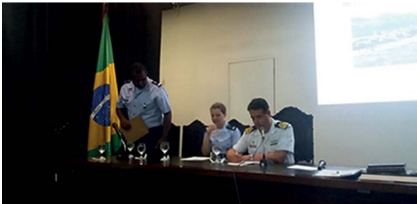
Abertura do XVI Congresso Internacional de História Aeronáutica e do Espaço da FIDEHAE

Entre 26 e 28 de abril de 2016, ocorreu o I Simpósio de História Militar no Museu Naval do Rio de Janeiro. O evento foi realizado pela Universidade Estadual de Londrina, Escola Superior de Guerra e Diretoria do Patrimônio Histórico e Documentação da Marinha e contou com a participação da Universidade da Força Aérea, entre os apoiadores.