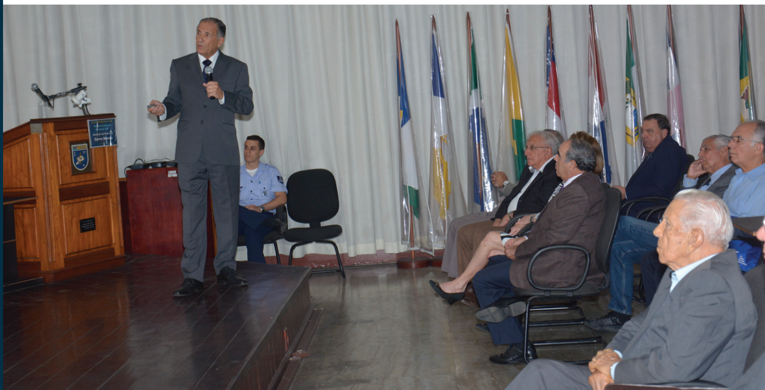
Momento da palestra realizada pelo General de Exército José Benedito de Barros Moreira

Além das constantes ameaças terroristas de grupos radicais, como o Estado Islâmico, a recente possibilidade de ataques cibernéticos a infraestruturas estatais, bem como uma nova geopolítica do poder devido à ascensão da China, ainda paira no mundo o terror de um conflito atômico. Essas foram algumas questões abordadas pelo General de Exército José Benedito de Barros Moreira no 240º Encontro no INCAER, com a palestra “As novas ameaças do Século XXI”, realizada no dia 25 de novembro, no auditório deste Instituto.