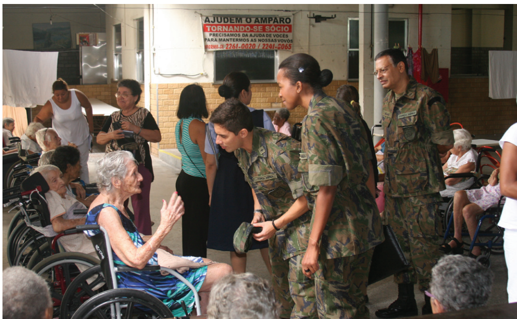
Representantes do INCAER fazem entrega de donativos ao Lar Amparo Thereza Cristina.

Uma gincana realizada pelo efetivo do INCAER, para estimular a solidariedade e celebrar o espírito natalino, arrecadou 2.171 kg de alimentos, 154 brinquedos e 1.388 peças de roupas, que foram doados para quatro instituições de caridade da região metropolitana do Rio de Janeiro.