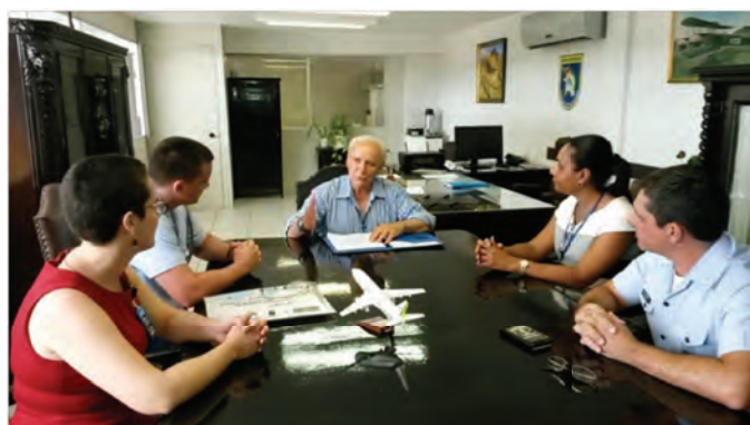
Técnicos do SISCULT em reunião com representantes do MUSAL

Além das especificidades de análise museológica e técnica de aeronaves, os especialistas discutiram temas como a gestão de bens culturais, transferência e desativação de unidades, gestão de projetos, música, produções artísticas e literárias, identificação e inventário de bens culturais, conservação preventiva e restauração, marcação de bens culturais, acondicionamento e higienização, segurança do acervo e das instalações, documentação museológica, custódia de bens, registro de bens culturais imateriais, dentre outros.