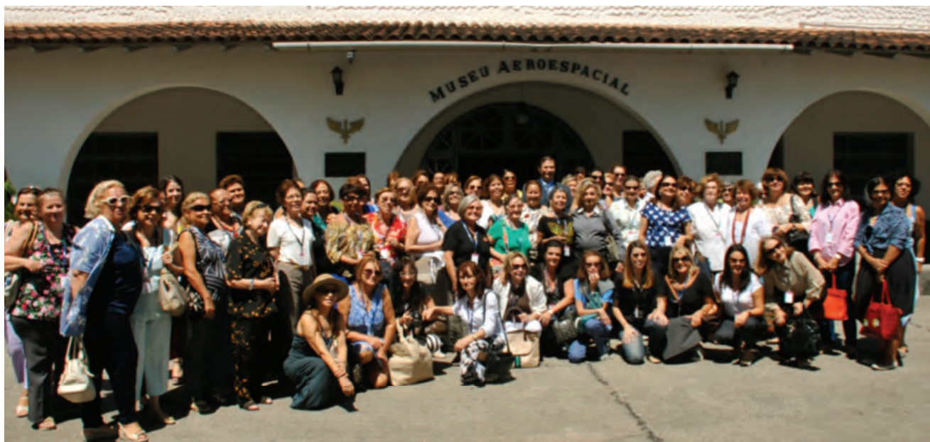
Integrantes do Programa de Atualização da Mulher posam em frente ao MUSAL.

O MUSAL recebeu a visita de 58 estagiárias do Programa de Atualização da Mulher, um curso realizado pela Escola Superior de Guerra (ESG) que objetiva proporcionar às mulheres conhecimentos acerca de seu novo papel na sociedade moderna. A visita ocorreu no dia 30 de outubro, com a presença do Diretor do Centro de Atividades Externas e de Extensão da ESG, Contra-Almirante Nilton Moreira Salgado.