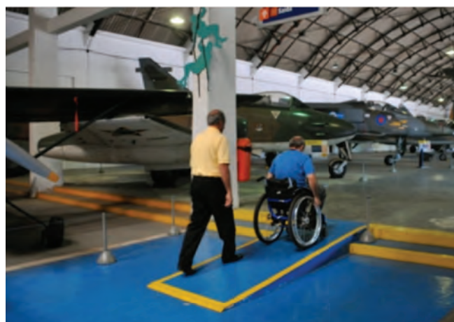
MUSAL garante acessibilidade a deficientes.

lazer e cultura”, ressaltou. Além do selo Rio Acessível, foram entregues, também, o caderno de orientações para melhorias em acessibilidade e certificado de participação.