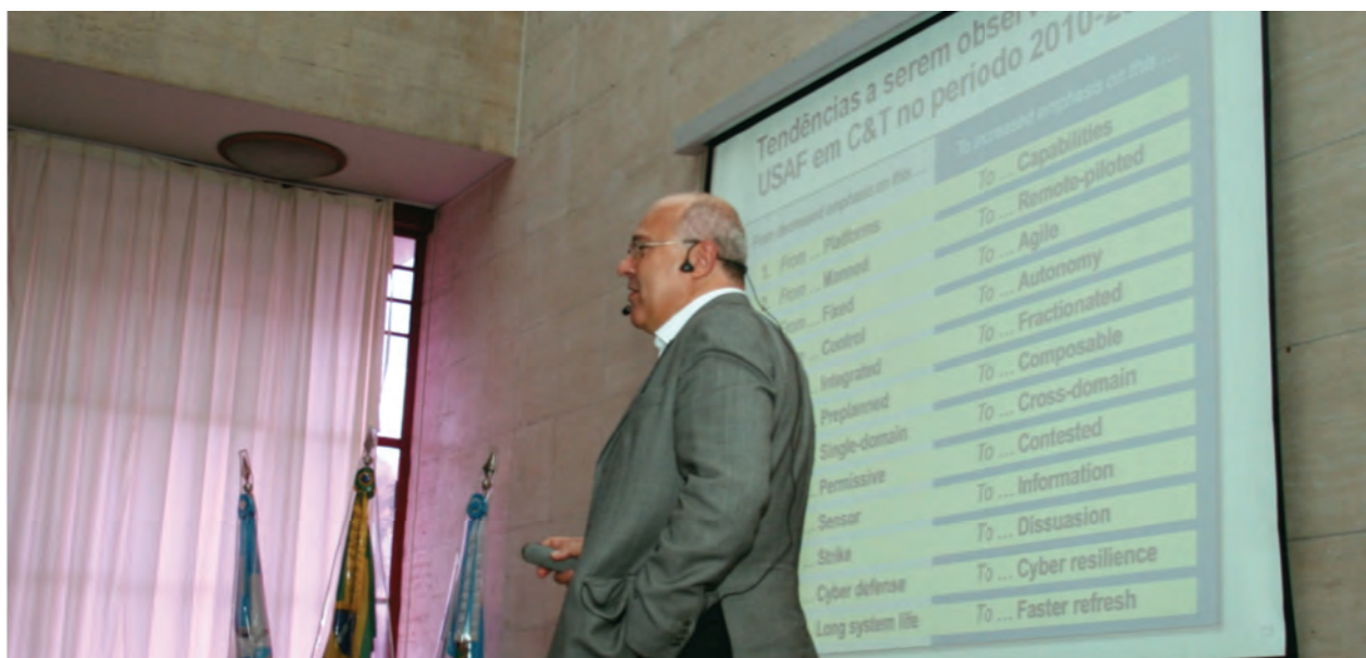
Brig Pazini profere a palestra O futuro do poder aeroespacial .

As tecnologias críticas que determinam a supremacia aérea de uma nação e suas implicações para o desenvolvimento da ciência e da inovação foram os principais temas abordados na palestra O futuro do poder aeroespacial , apresentada pelo Brigadeiro Engenheiro Maurício Pazini Brandão, no 232º Encontro no INCAER, que ocorreu no dia 26 de novembro.