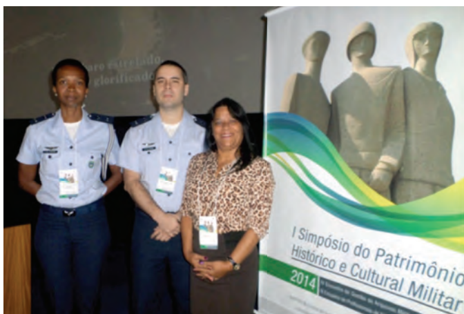
Representantes do INCAER na Escola de Guerra Naval