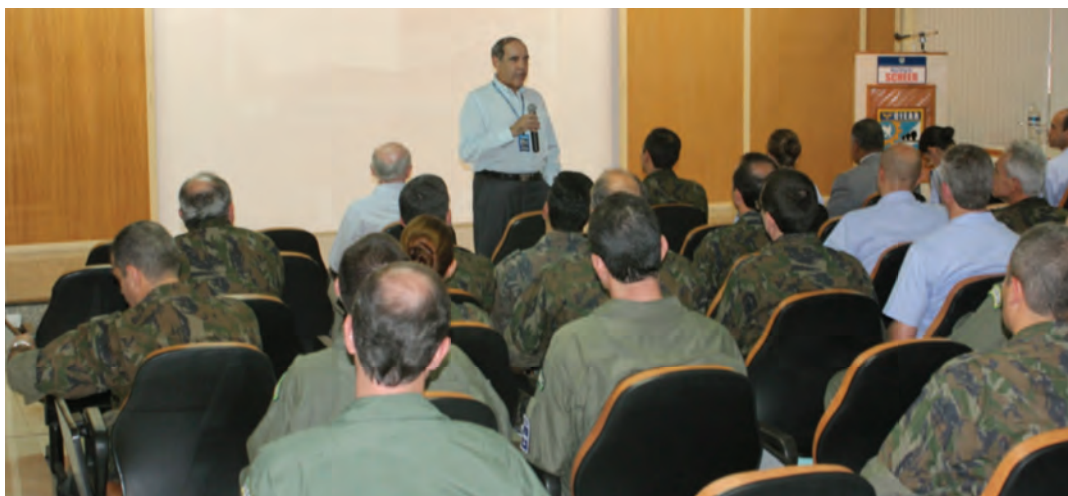
Abertura da palestra para os alunos do CIEAR