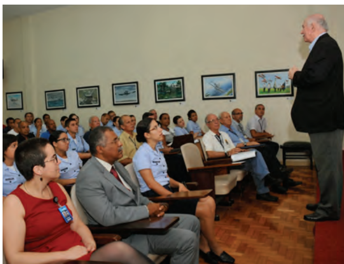
Palestra do Maj Brig Scheer no MUSAL

Com o objetivo de difundir o Sistema de Patrimônio Histórico e Cultural do Comando da Aeronáutica (SISCULT) e orientar as Organizações da Força Aérea quanto à produção, difusão e proteção de bens culturais, o INCAER realizou visita técnica ao Museu Aeroespacial (MUSAL), entre os dias 3 e 7 de novembro.