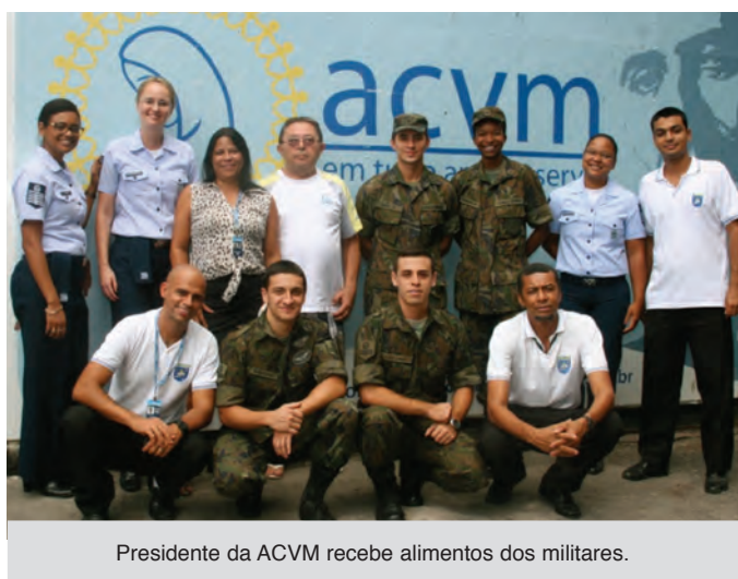
Presidente da ACVM recebe alimentos dos militares.

básicas, para a população carente que vive no entorno da Associação. Com 44 anos de existência, a ACVM é reconhecida pelo Conselho Municipal de Assistência Social e possui Título de Utilidade Pública pelo trabalho de assistência social que vem realizando em prol da sociedade.