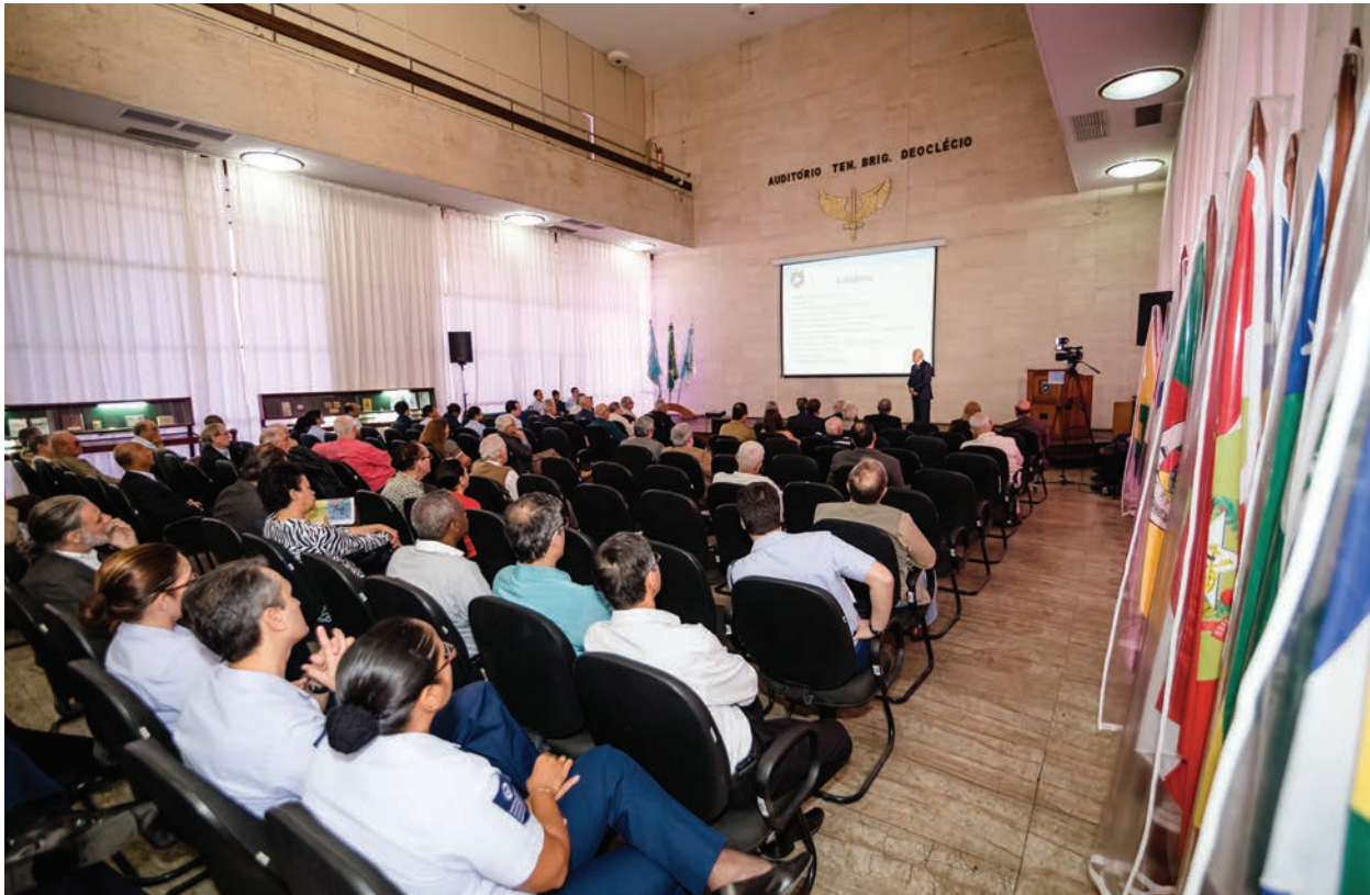
Momento da palestra Edu Chaves: pioneiro e ás da aviação

O Instituto Histórico-Cultural da Aeronáutica (INCAER) realizou, no último dia 30 de julho, a palestra Edu Chaves: pioneiro e ás da aviação , apresentada pelo Conselheiro do INCAER, Brig Ar Refm Clóvis de Athayde Böhrer. O palestrante desvendou a vida e a obra do insigne aviador, descrevendo histórias e fatos pitorescos dos primórdios da aviação mundial e do Brasil.