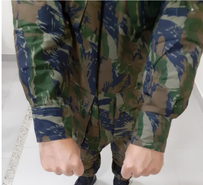
5 – Gandolas arriadas.