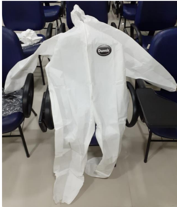
1 – Macacão de proteção contra respingos.