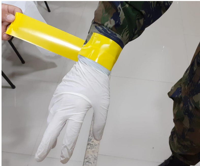
6 – A luva de procedimentos deve ser colocada por cima da gandola e presa com fita impermeável. Não fixar de forma vigorosa, mas sim utilizando o mínimo de força, somente para que a luva/gandola não soltem.