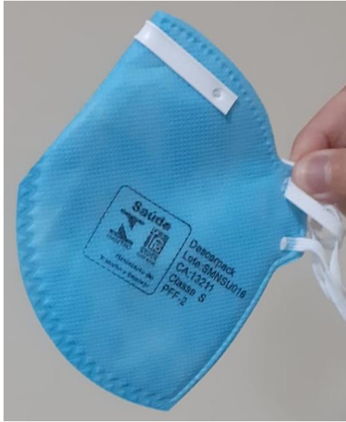
3 – Máscara de proteção N95.