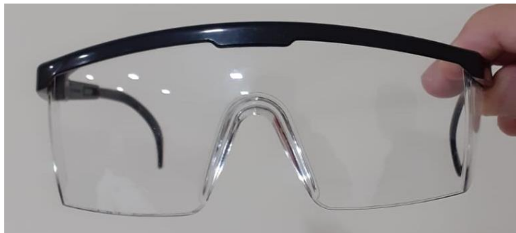
2 – Óculos de proteção.