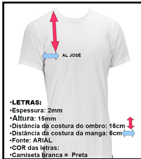
Figura 2 - Instruções para estampa da camiseta olímpica