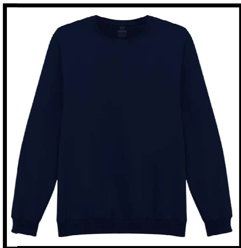
Figura 5 – Casaco tipo moletom azul marinho