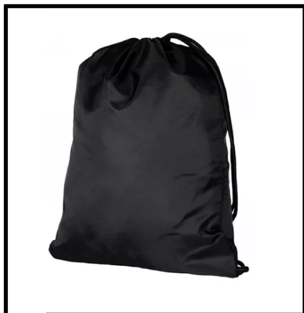
Sacola para transporte de tênis colorido