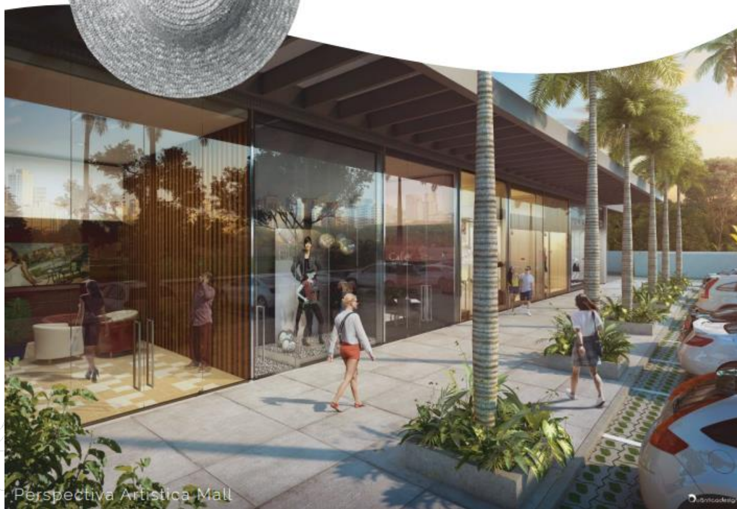
Perspectiva Artística Mall