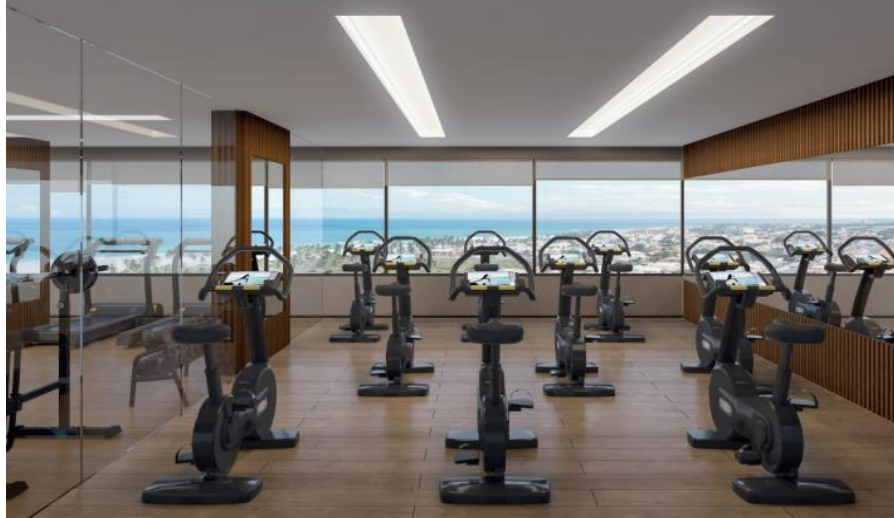
Perspectiva Artística da Sala de Spinning