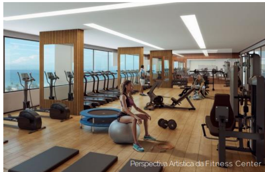
Perspectiva Artística da Fitness Center