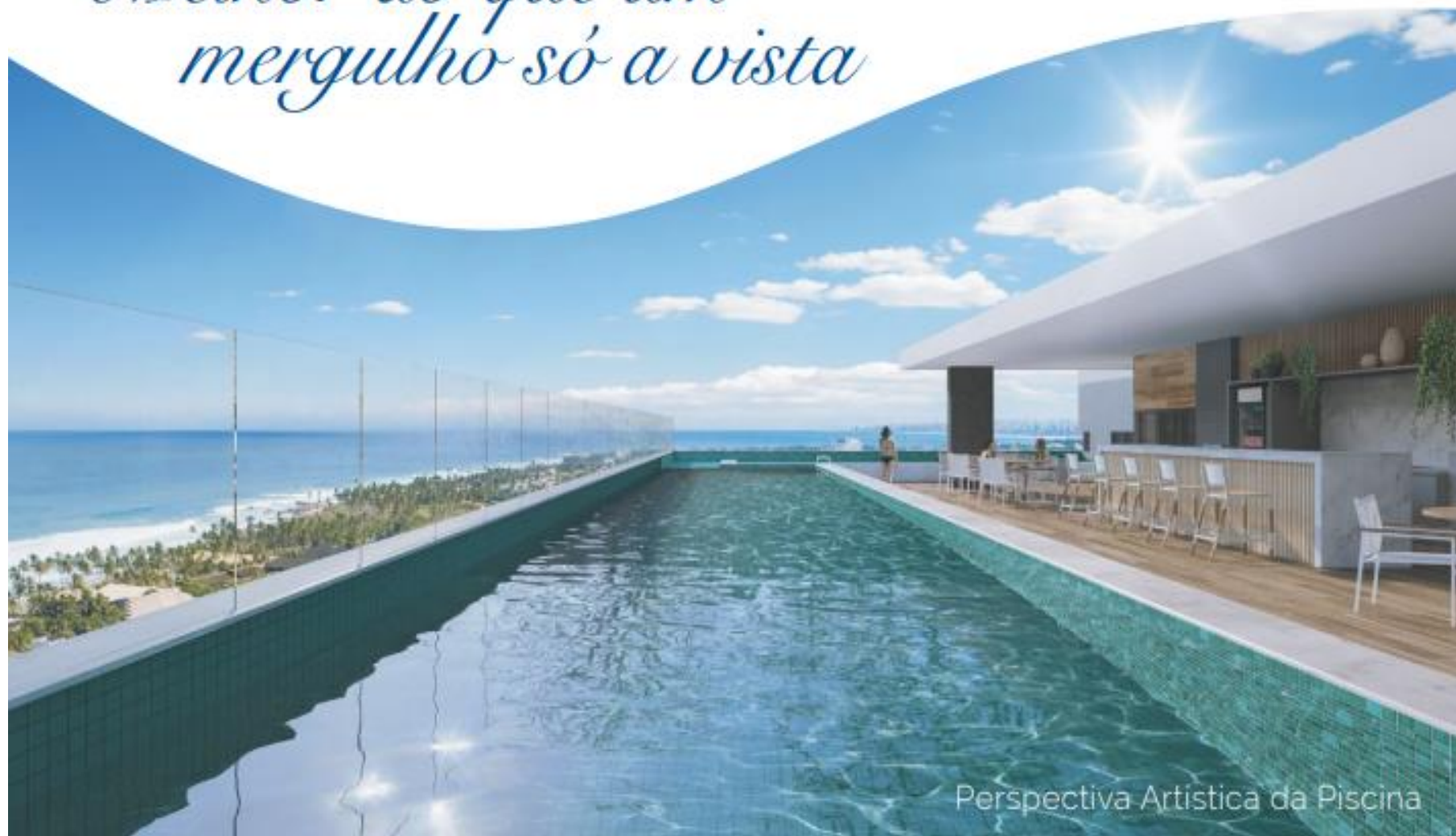
Perspectiva Artística da Piscina