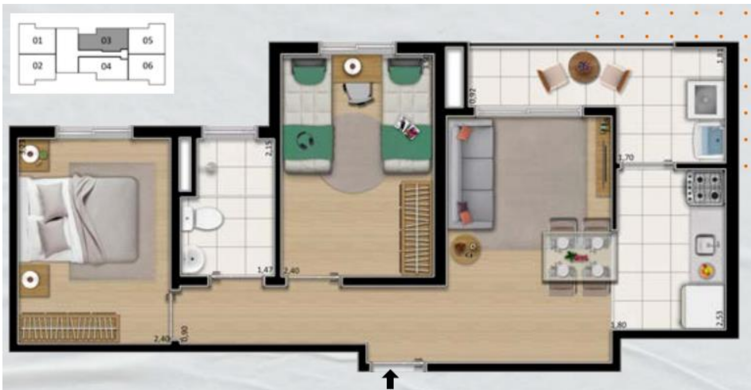
APARTAMENTO FINAL 3 E 4