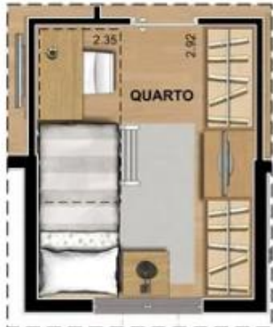
SUGESTÃO DE LAYOUT COM BELICHE