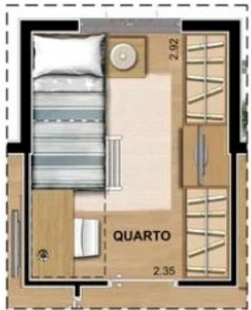
SUGESTÃO DE LAYOUT COM BELICHE