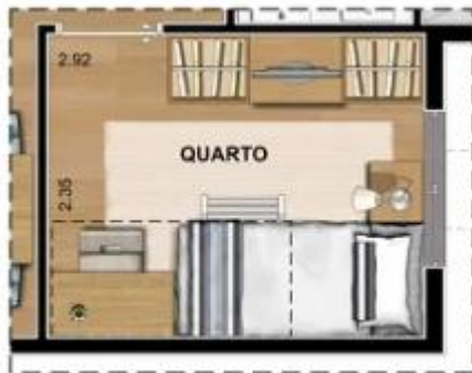
SUGESTÃO DE LAYOUT COM BELICHE

Aptos 202 a 1602 Aptos 203 a 1603 Aptos 207 a 1607 Aptos 208 a 1608