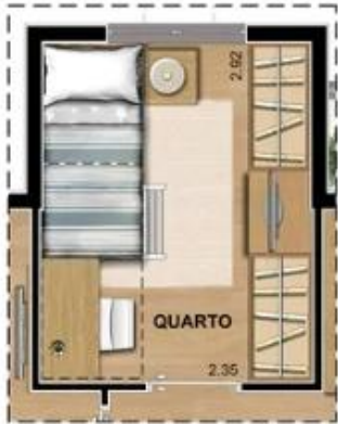
SUGESTÃO DE LAYOUT COM BELICHE