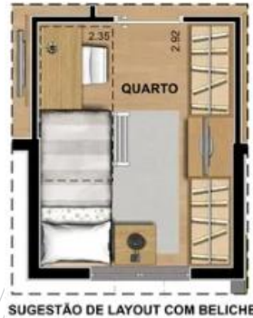
SUGESTÃO DE LAYOUT COM BELICHE