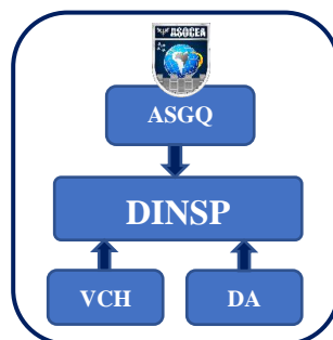
Figura 1 – Visão sistêmica do SGQ da ASOCEA

Os limites e fronteiras do Sistema estão clarificados na figura 1, a qual apresenta a visão sistêmica do SGQ da ASOCEA.