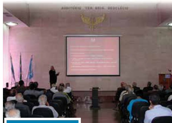
Momento da palestra “Os países do BRICS e a evolução dos centros de poder”