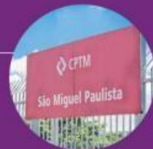
CPTM São Miguel Paulista