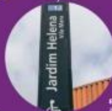
Estação de trem Jardim Helena