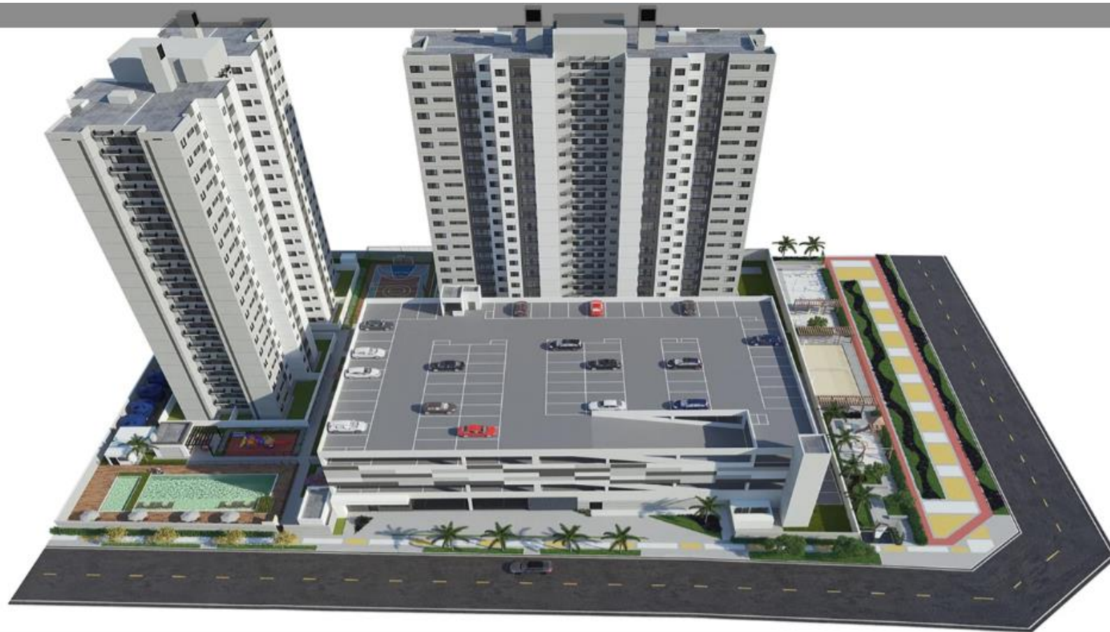
Implantação Plaza Residence MRV Natal