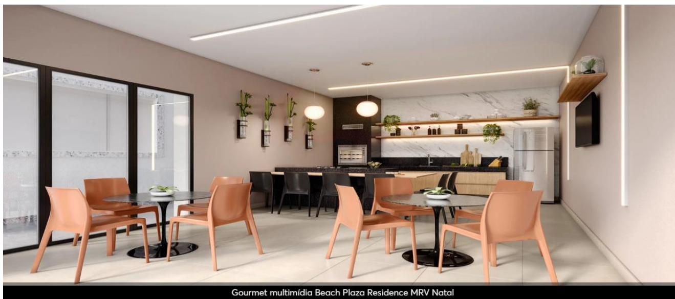
Gourmet multimídia Beach Plaza Residence MRV Natal