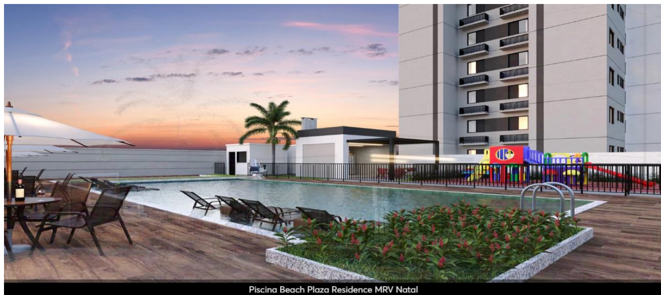
Piscina Beach Plaza Residence MRV Natal