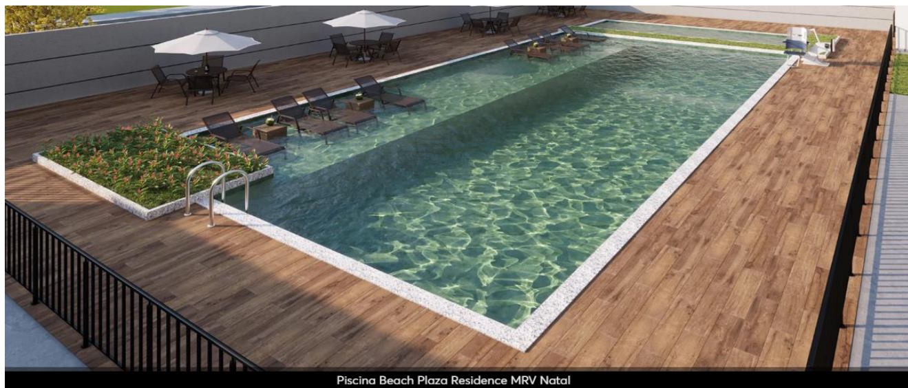
Piscina Beach Plaza Residence MRV Natal