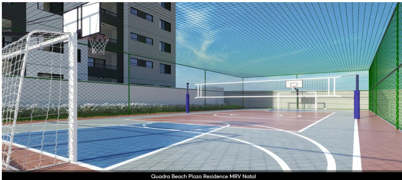
Quadra Beach Plaza Residence MRV Natal