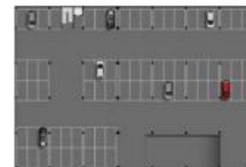
EDIFÍCIO GARAGEM - 3º PAVIMENTO