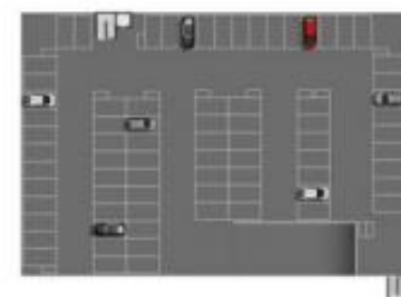
EDIFÍCIO GARAGEM - 5º PAVIMENTO