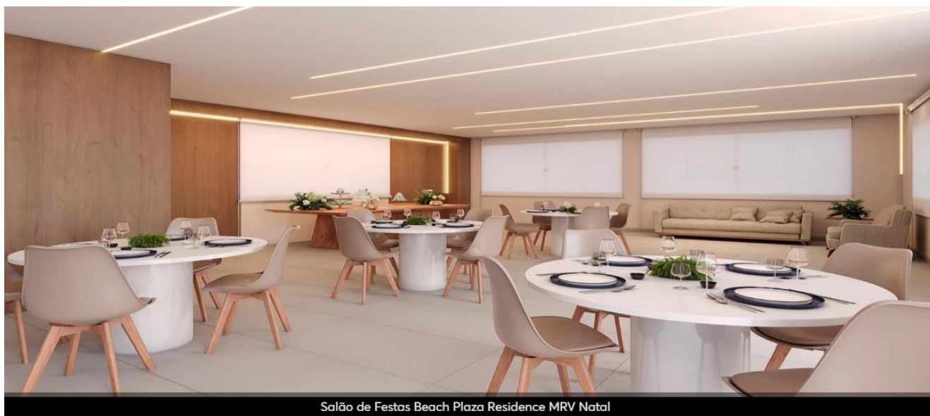
Salão de Festas Beach Plaza Residence MRV Natal