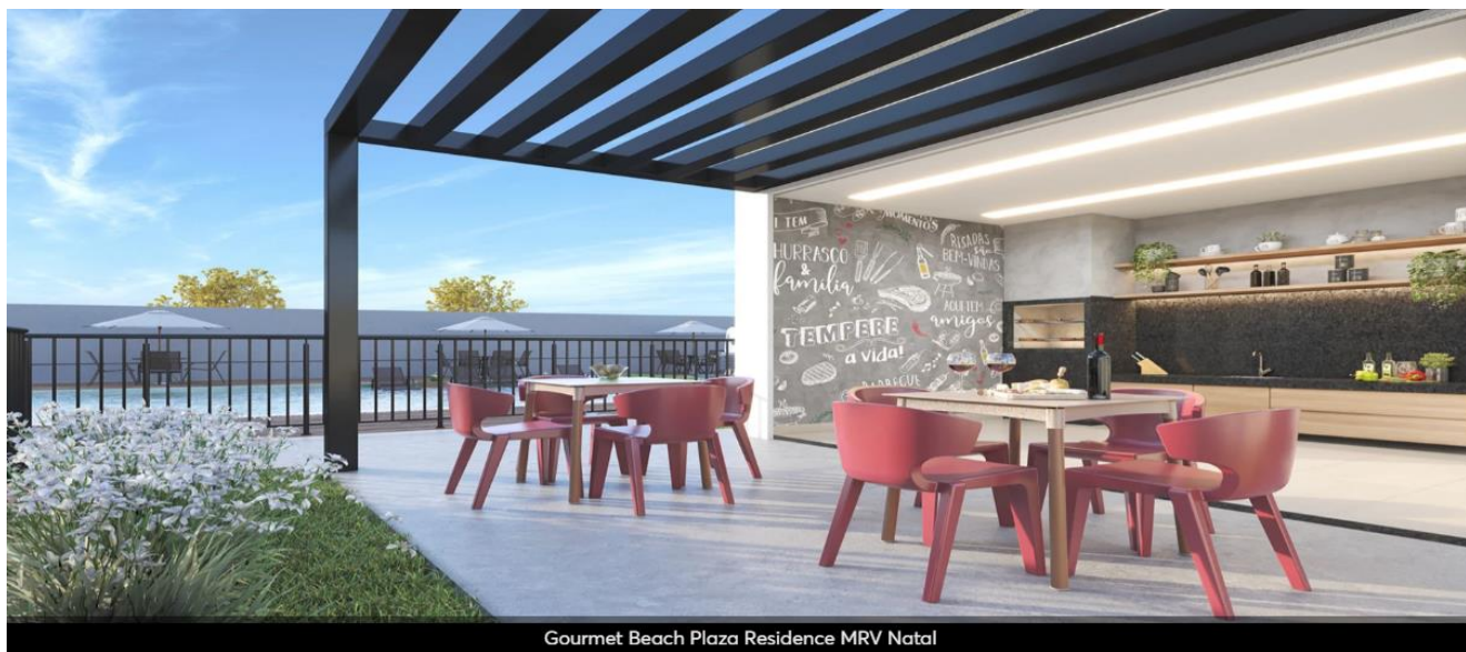
Gourmet Beach Plaza Residence MRV Natal