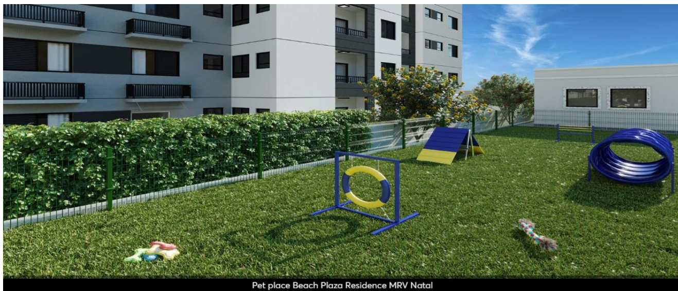
Pet place Beach Plaza Residence MRV Natal