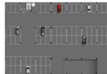
EDIFÍCIO GARAGEM - 2º PAVIMENTO