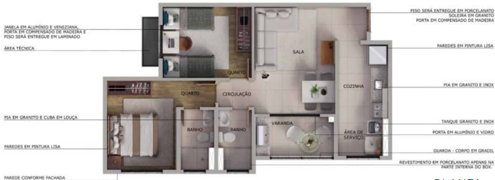
BEACH PLAZA RESIDENCE - TORRE 01 - APTO 607