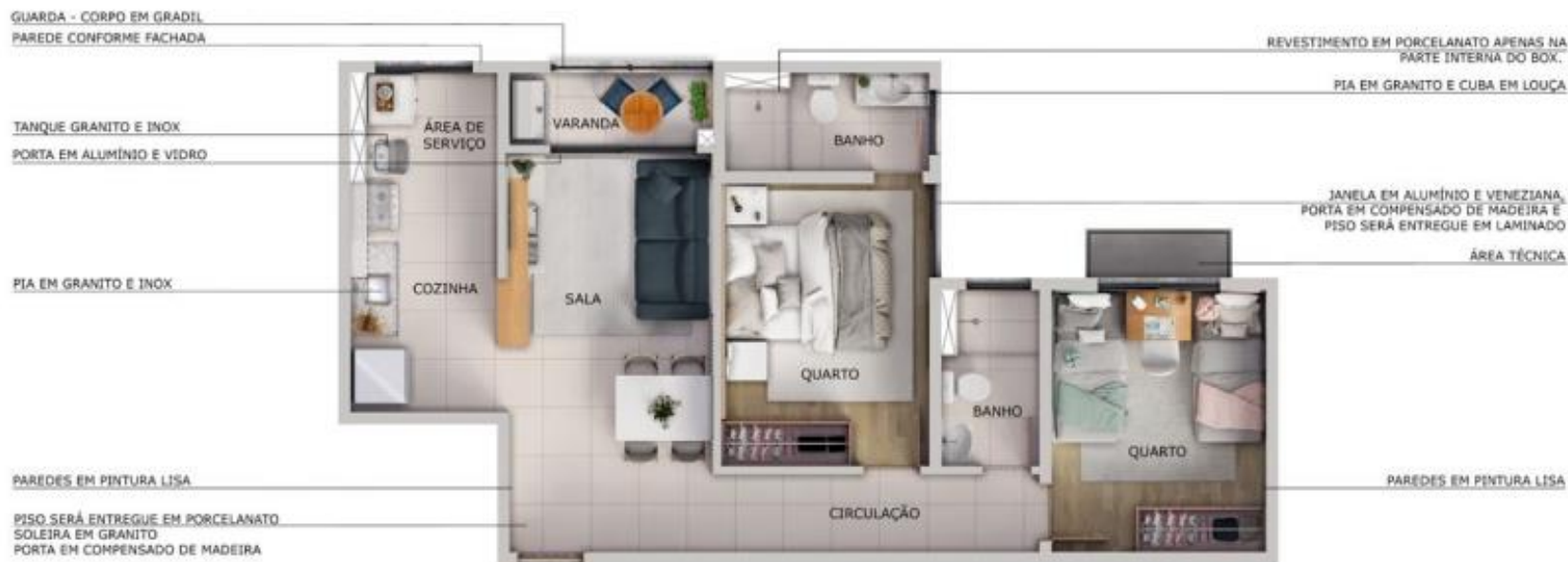
BEACH PLAZA RESIDENCE - TORRE 01 - APTO 606