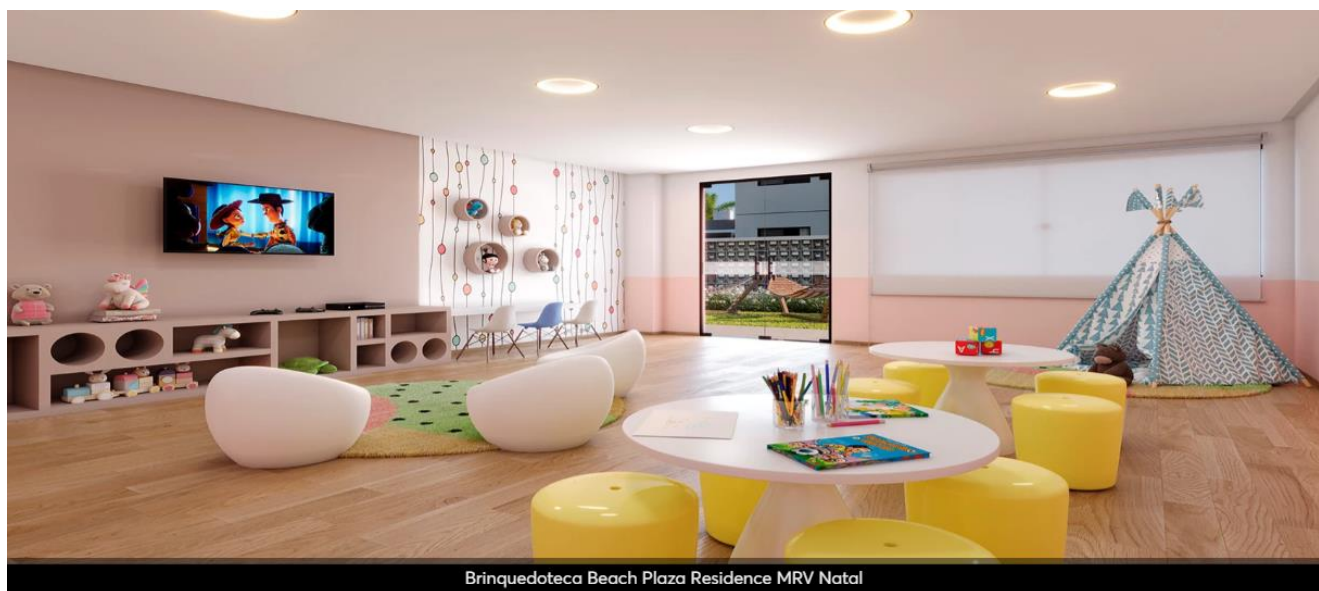
Brinquedoteca Beach Plaza Residence MRV Natal