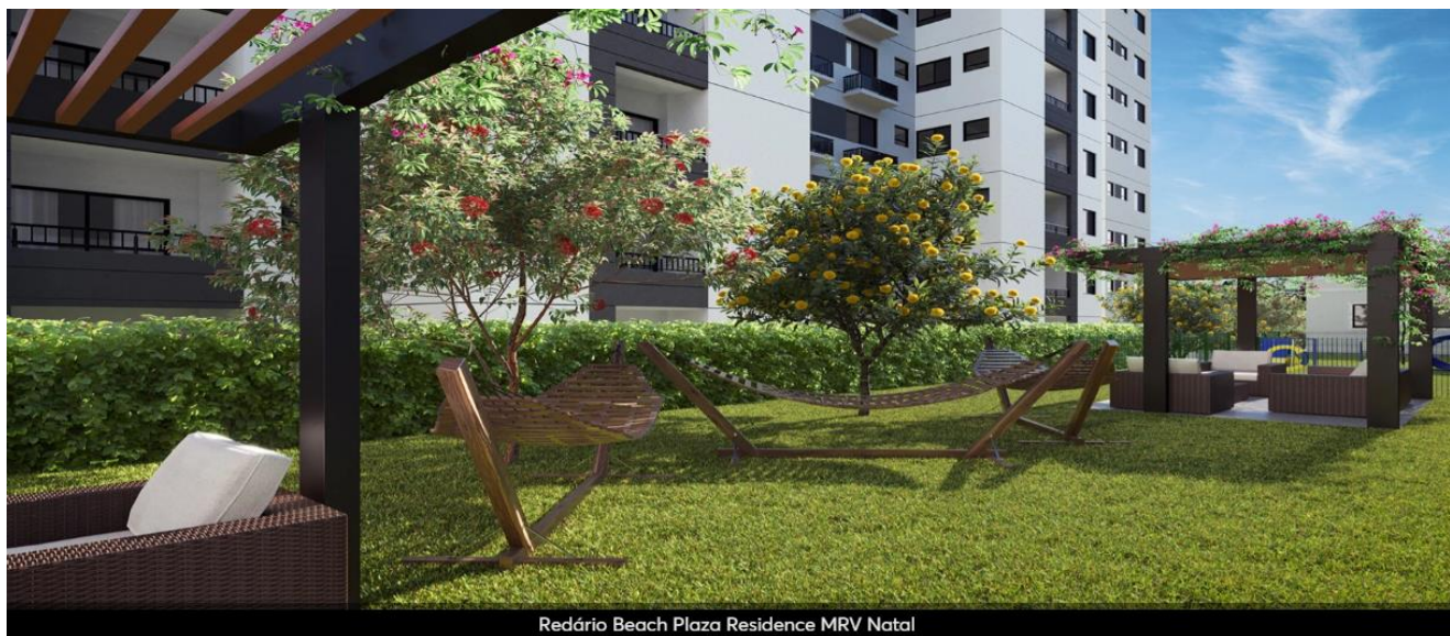
Redário Beach Plaza Residence MRV Natal